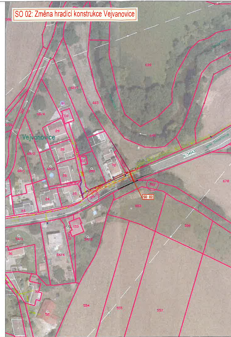
SO 02: Změna hradící konstrukce Vejvanovice