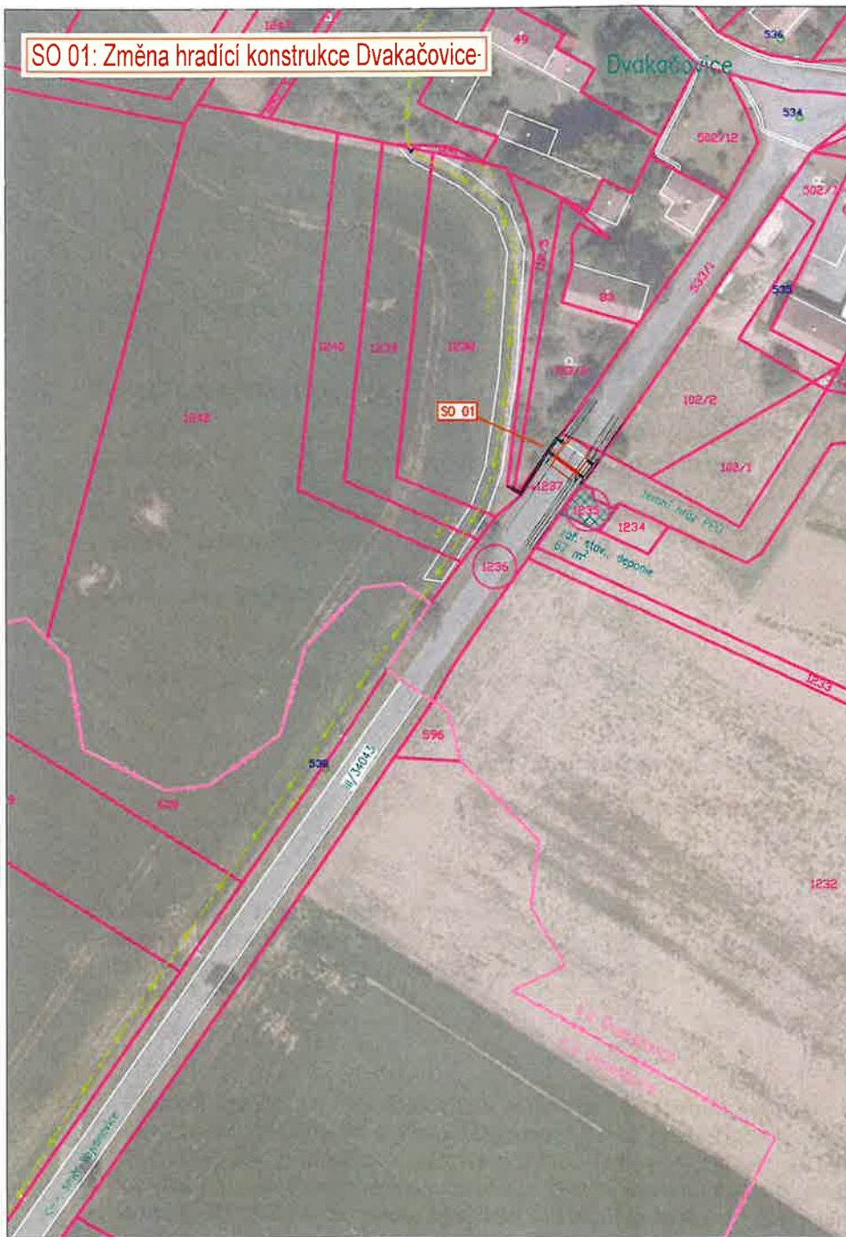
SO 01: Změna hradící konstrukce Dvakačovice